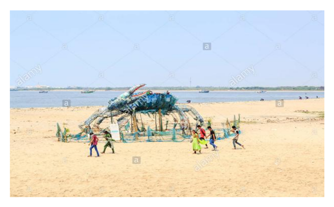
The Mad Crab, an installation or sculpture made of waste plastics to highlight environmental issues, Fort Cochin, Kerala, India