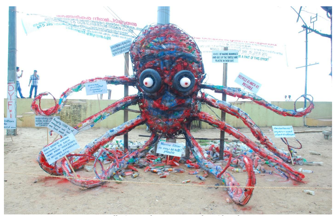
Installation art by CMFRI at Cherai beach