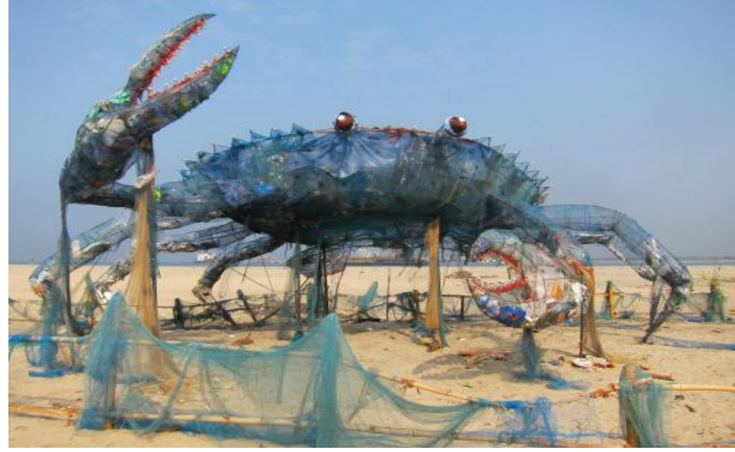
A crab made of fishing nets. And it was being filled with plastic garbage that had been collected from the beach. The crab was representative both of the sea creatures who succumb due to pollution in the seas and also of the rising incidence of cancers due to environmental pollution.

The Mad Crab on the beach, an installation art with Waste Plastics. Plastics and similar non-biodegradable wastes form the most important threat to marine ecosystems in the 21st century. This was an effort which CMFRI initiated as a continuation in creating awareness on reducing plastic debris and curbing coastal pollution